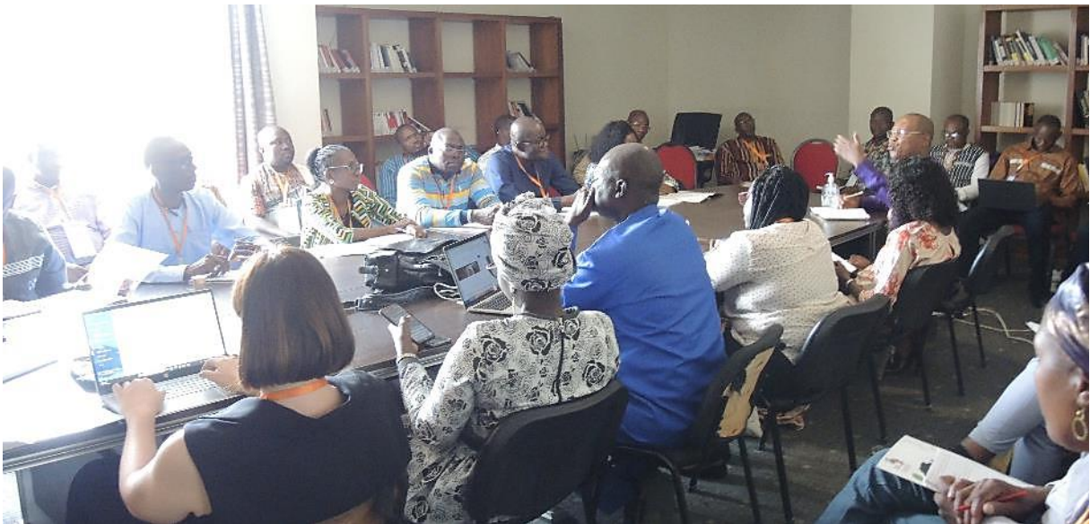
Atelier de l'ONU-HABITAT

Enfin, cet atelier a constitué une opportunité pour présenter la méthodologie et les objectifs du Cadre d'Évaluation de la Circularité pour le Secteur de la Construction des Bâtiments, propre au contexte du Sénégal.