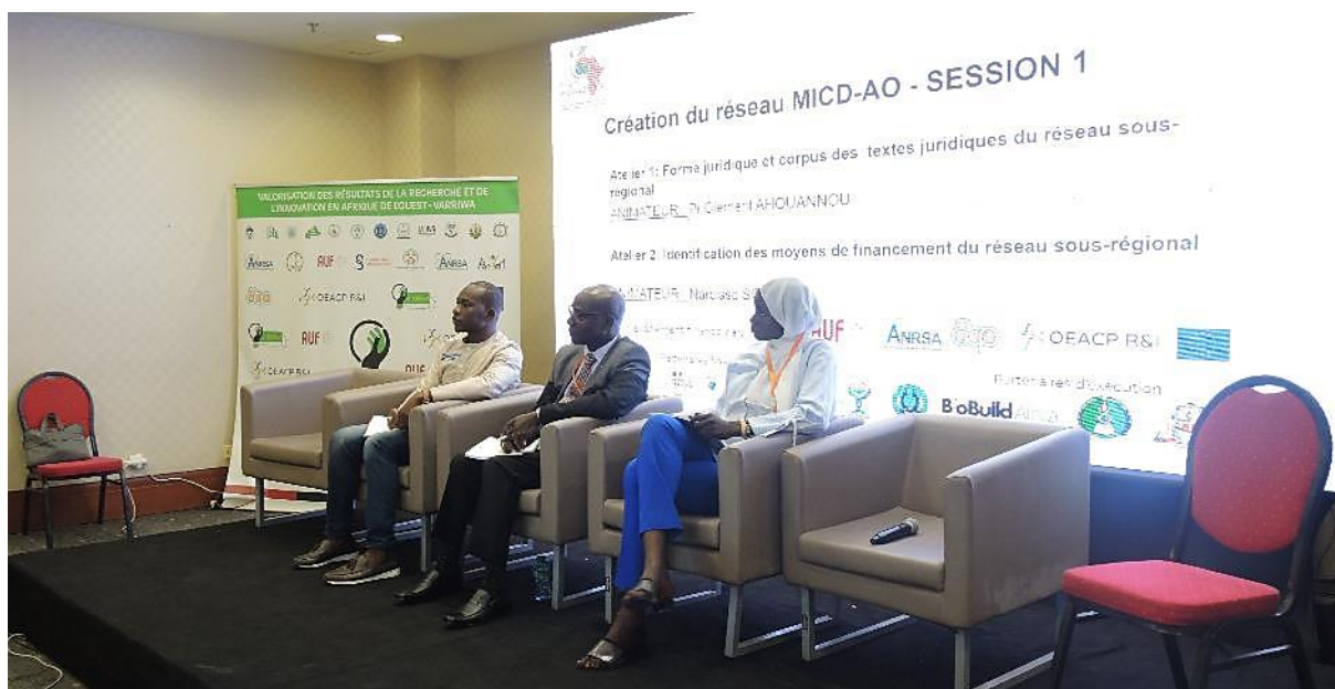
Panel sur la création du réseau

De plus un petit comité de neuf membres a été mis en place afin de poursuivre la réflexion. Ce comité est composé du Burkina Faso, du Togo, du Bénin, de la Guinée Bissau, de la Cote d'Ivoire, du Niger, du Mali, de la Mauritanie et du Sénégal.