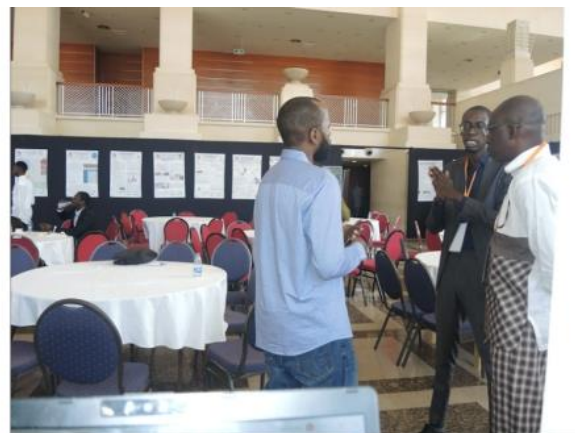
L'espace d'exposition des stands