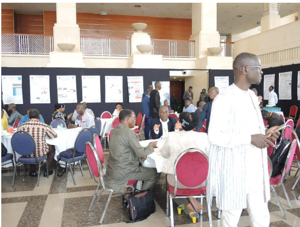
Zone de restauration d'interactions Professionnelles