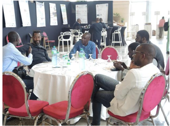
Hall d'échange et rencontre BtoB, de restauration