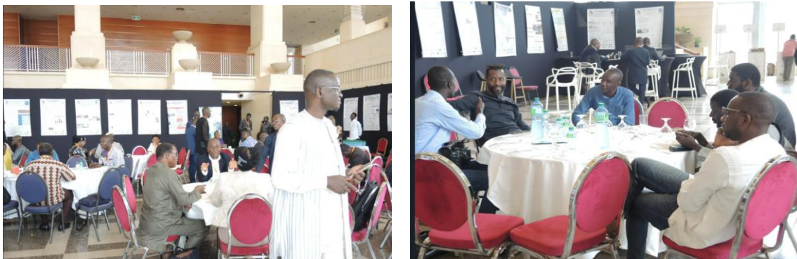
Rencontre B2B entre participants des différents pays

Pendant les cours des rencontres Be to Be, les divers partenaires présents au forum (entreprises, structures administratives, projets, laboratoires, organisations de la société civile) ont discuté de manière informelle de sujets d'intérêts communs, allant des opportunités de coopération à de simples découvertes.