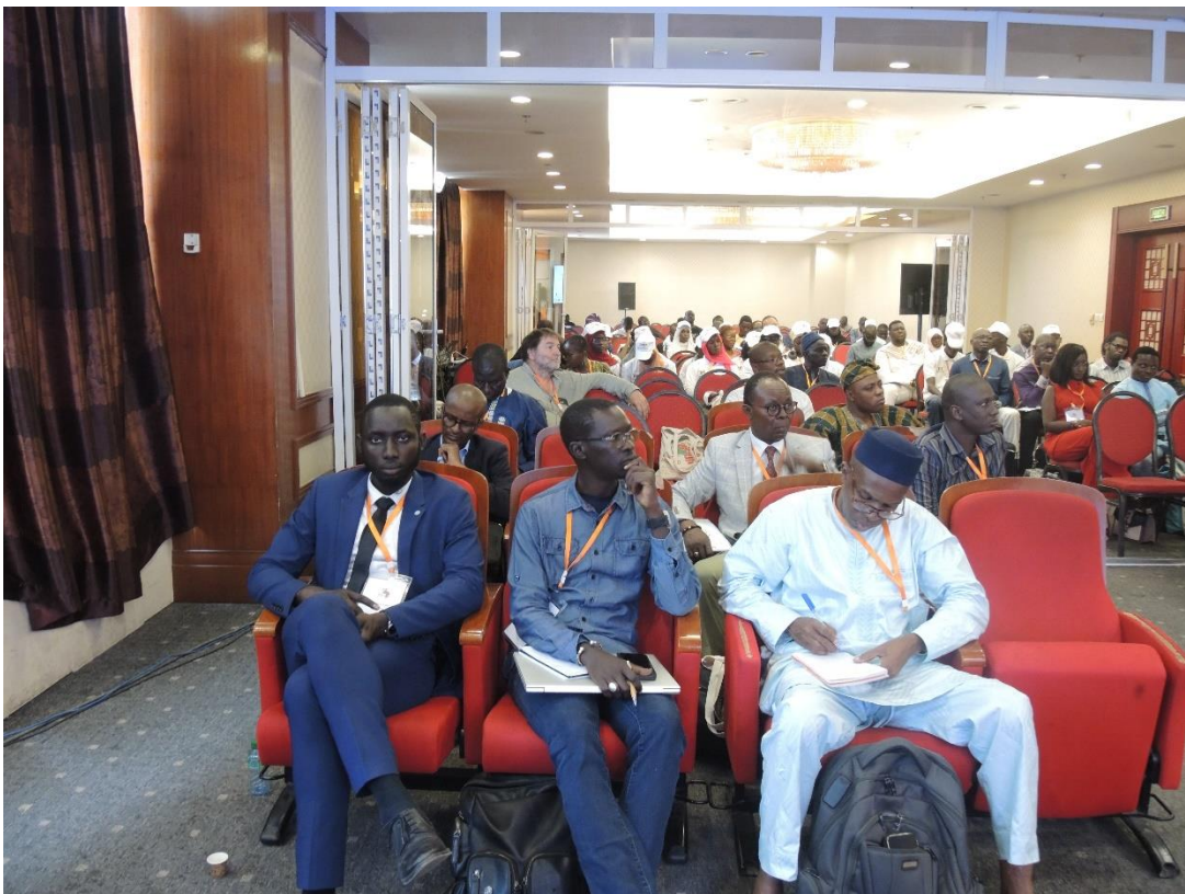
Salle de plénière