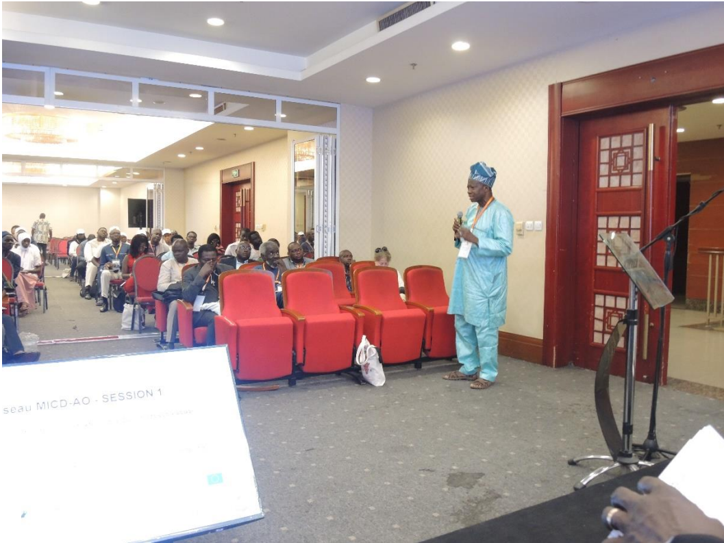
Participation des différents Intervenants